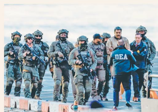
El exmandatario fue trasladado bajo una fuerte custodia

Maduro ante el juez: "No soy culpable, soy un hombre decente"