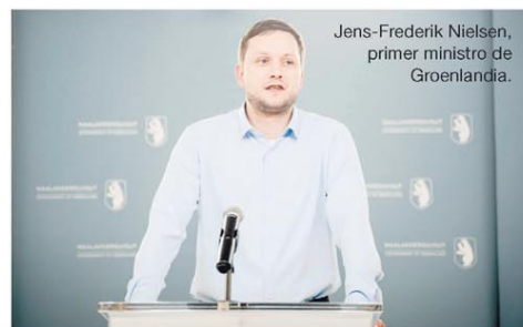
Jens-Frederik Nielsen, primer ministro de Groenlandia.