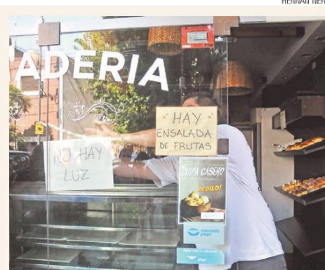
"No hay luz", una postal recurrente de cada verano

El trigo cerró una cosecha histórica y alcanzó los 28,7 millones de toneladas PÁG. 4