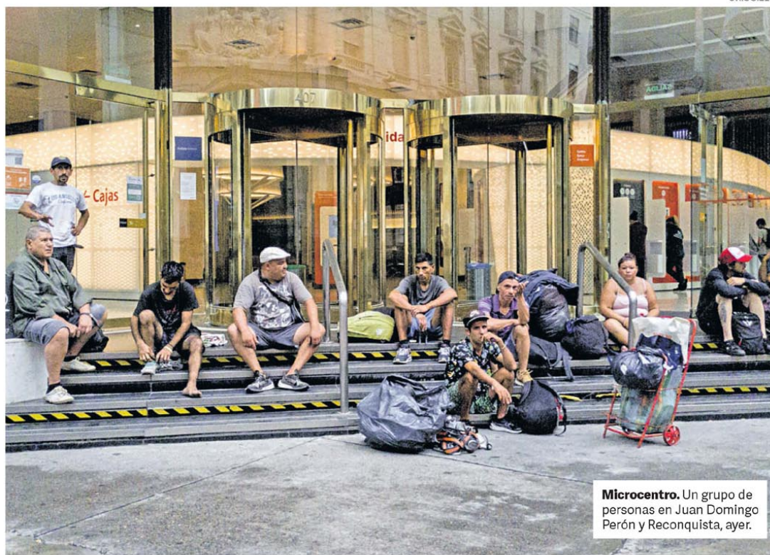
Microcentro. Un grupo de personas en Juan Domingo Perón y Reconquista, ayer.

El Gobierno definió los aumentos que entrarán en vigencia desde mediados de febrero. Con la actualización, la tarifa mínima para autos en la hora pico será de $ 1.500. Las subas alcanzan a las autopistas Riccheri, Ezeiza-Cañuelas, Rosario-Córdoba y Buenos Aires-Rosario. También aumentarán los precios de los peajes de las rutas 205, 3, 5, 7, 8, 9 y 12. P.17