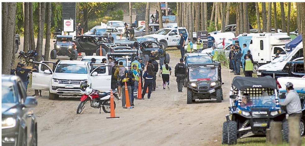
MARCELO MANERA/ENVIADO ESPECIAL

sociedad. PINAMAR. Desde el sábado, tras el trágico choque en el que un niño recibió heridas gravísimas, la zona de La Frontera funciona bajo un nuevo esquema de control, con presencia policial permanente y operativos que se mueven según el flujo de vehículos; el objetivo es disuadir maniobras peligrosas y reducir la siniestralidad. Ya se incautaron 16 UTV, 11 cuatriciclos y varias camionetas, pero las maniobras peligrosas aún persisten. Página 19