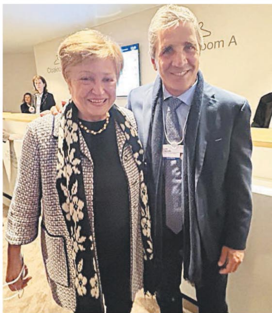
Georgieva postea una foto con el ministro Luis Caputo en Davos

En noviembre acumuló la segunda baja consecutiva de acuerdo con información del Indec. El dato anual muestra un estancamiento