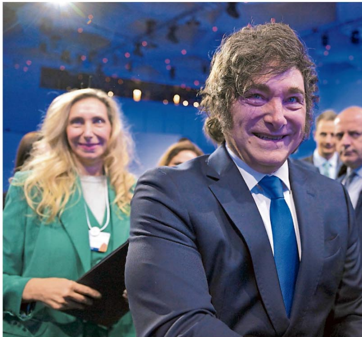
Karina y Javier Milei, ayer, en Davos, Suiza