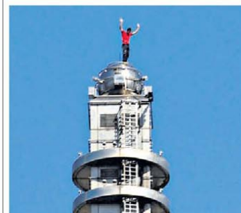
Hazaña. Alex Honnold, en la cima.

En un desafío que vieron millones de personas en vivo por Netflix, el norteamericano Alex Honnold -de 40 años y estrella de la escalada- llegó a lo más alto del Taipéi 101, sin cuerdas ni equipo de seguridad. Tardó una hora y media y al terminar se tomó una selfie. Ya había hecho un récord en el Yosemite. P.36