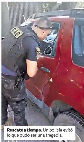
Rescate a tiempo. Un policía evitó lo que pudo ser una tragedia.

El documento establece que Argentina debe prohibir importaciones desde lugares donde el trabajo es "forzado o compulsivo".