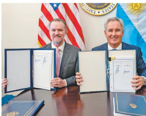
El representante de Comercio, Jamieson Greer, y el canciller Quiroga en la firma del entendimiento

Amplía el acceso preferencial de carne y elimina aranceles para 1.675 productos argentinos. EE.UU. ingresará sin tarifas bienes de capital, dispositivos médicos y compuestos químicos