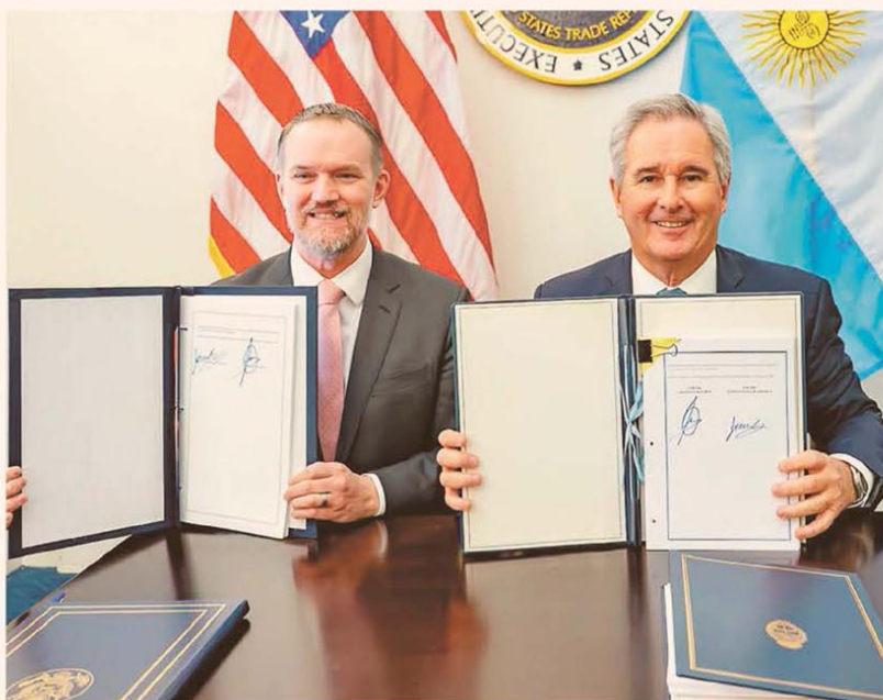
Jamieson Greer, titular de la Oficina de Representación Comercial (USTR), junto al canciller Pablo Quirno

El gobierno argentino y la administración de Donald Trump completaron ayer la negociación del acuerdo comercial anunciado en noviembre. El canciller Pablo Quirno, encargado de firmar el documento, hizo ayer el anuncio desde Washington junto a su equipo. El entendimiento se propone "profundizar la cooperación bilateral en materia de comercio e inversión" y facilitará el financiamiento de las compañías estadounidenses que operen en el país. EE.UU. eliminará los aranceles para 1675 productos argentinos. Este paso permitirá recuperar exportaciones por u$s 1013 millones. Además, amplía a 100.000 toneladas el acceso preferencial a la carne bovina argentina, 80.000 toneladas más que el año pasado. Por su parte, la Argentina eliminará 221 aranceles de maquinaria, transporte, dispositivos médicos y químicos, y bajará al 2% el arancel de otras 20 posiciones, principalmente autopartes. También se compromete a facilitar la inversión estadounidense en la exploración, extracción, procesamiento, transporte y exportación de minerales críticos y recursos energéticos — P. 4 y 5