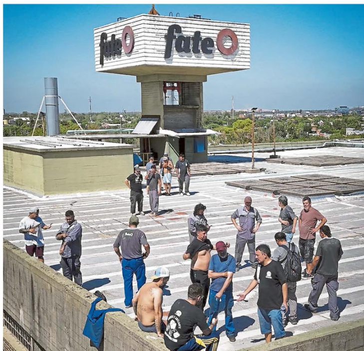
Parte de la comisión interna de la empresa protestaba ayer en el techo de la planta