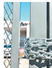
Cadenas en el acceso

La CGT apuesta a una medida contundente: "Argentina se paralizará de punta a punta"