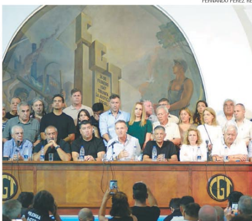
La conducción de la CGT ayer, en conferencia de prensa

A pesar de que se avanzó con cambios en el texto, las centrales sindicales confirmaron la medida de fuerza y se tensa el clima político